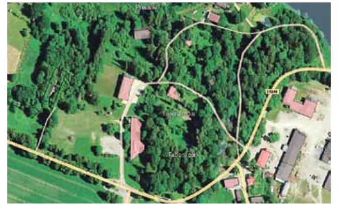
Tsooru mõisapark enne tormimurdu. Foto keskmes on Tsooru rahvamaja ja Tsooru kolhoosi kontor, vasakul servas on Seedrimäni kinnistu, mille sees musta kastiga piiritletud Tsooru kolhoosi sigala varemed.