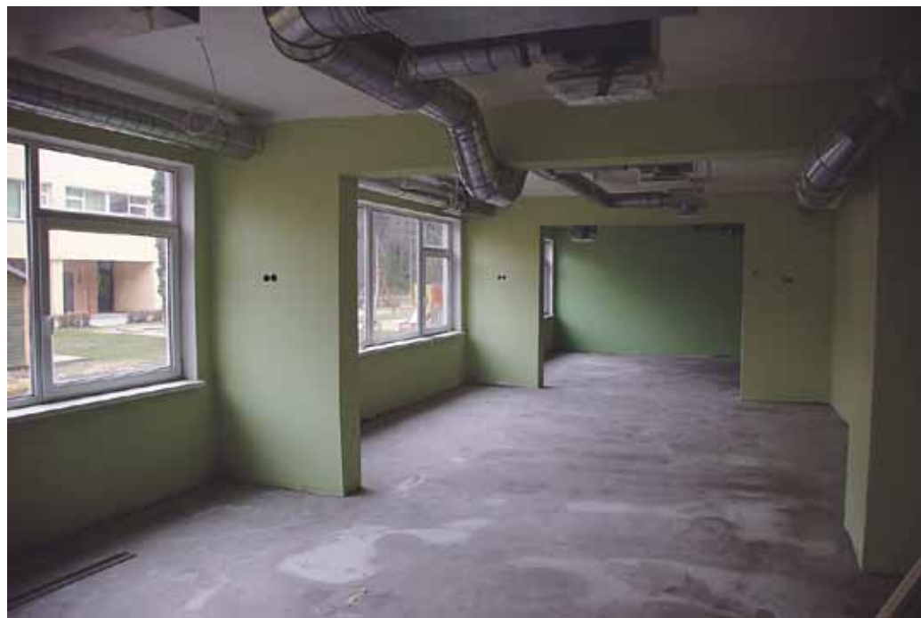
Lusti lasteaia sõimerühmas on põrand valatud ja ventilatsioonitorustik laes. Sõimerühma avamine on plaanitud 2. jaanuaril 2024. Foto on tehtud 17. novembril 2023.

12. oktoobril, mil sõimerühma ruumid oleksid pidanud esialgsete plaanide kohaselt valmis olema, räägiti taas eelnimetatud komisjonis Lusti lasteaia. Ilmneb, et selleks ajaks oli ehitustööd tehtud