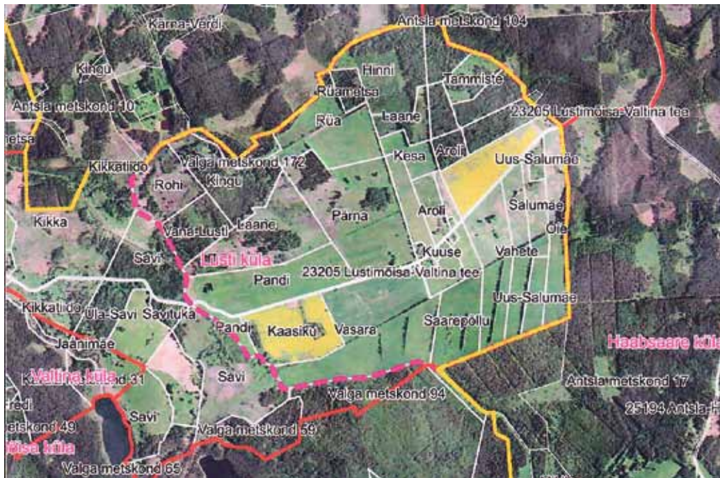
Maa-ameti ortofoto aluskaardil on kollase joonega piiritletud Lusti küla ja lilla katkendliku joonega märgitud Lusti küla jagunemise piir Lusti ja Lustimõisa küla vahel.

kogukondi ja pole päris õige nimetada kogukonda küla-piiri järgi. Oluline on, kuidas kogukonnad omavahel sobituvad.