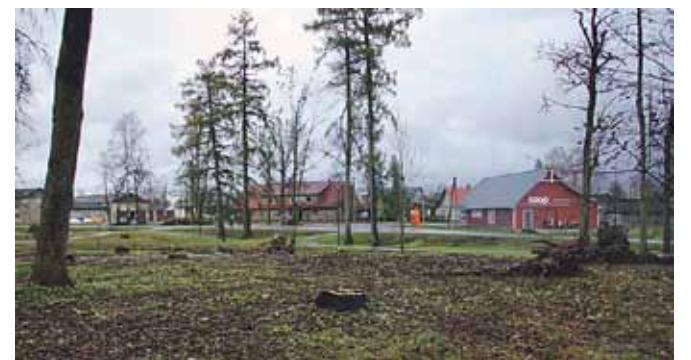
Tsooru pargis pärast tormimurru likvideerimist jäid kasvama üksikud puud. Foto on tehtud 10. novembril 2023.

Arvatavasti on seotud paar aastat tagasi valla mainekujunduseks loodud eelarve rida 3 000 euroga ja paar aastat tagasi on Antsla valla poolt You Tube-i üles laetud ka mõned Maero Puki kokkumonteeritud lühifilmid öitsvast Antsla linnast ja mõnedest valla uusehitustest. Filmide vaatajaskond on olnud päris suur. Kindlasti aitas see ettevõtmine palju kaasa valla maine kujundamisele, sest sel ajajärgul räägiti vallakodanike hulgas palju kiiresti arenenud Antsla vallast ja linnapildi ilusamaks muutmiseks. Näitena toodi just neid objekte, mis filmilindil kajastatud. Millegipärast levivad vallas jutud, et nende filmide loomisest oli ka teine tagamõte. Toimusid ju sama aasta sügisel (2021. aasta oktoobris) kohalike omavalitsuste valimised. Teame Eestis nii mõndagi juhtumit, kus valimiste eel on kasutatud rahva raha valimiskampaania tegemiseks.