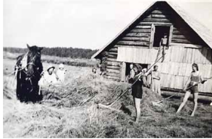
Heinategu Tiitsa talus. Foto on tehtud 1938-1942. aastal.