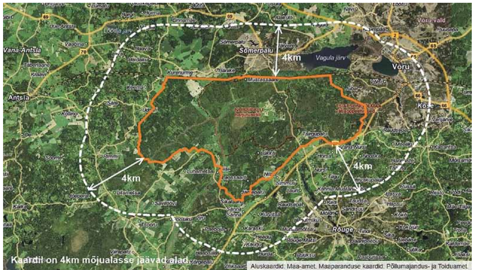
Nursipalu kümnetuhande hektari suurune polügoon ja harjutusvälja mõjualasse jääv nelja kilomeetrine tsoon.

Valla keskkonnaspetsialisti vastusest selgub, kui suur mõju on meedial. Vallaametnikult on meediaga suhtlemisel võetud sõnavabadus. Et meedia küsimustele anda oma tööalast vastust, peab see enne läbima mitu kontrollidistantsi. Küll aga võivad vallaametnikud rääkida volikogus ja vallakodanikega suhtlemisel kõike, mida soovivad. Nii ongi kuvatud Antsla vallast laiale avalikkusele ilus roosiline pilt, kuid valla seesmine elu keeb vastuoludest.