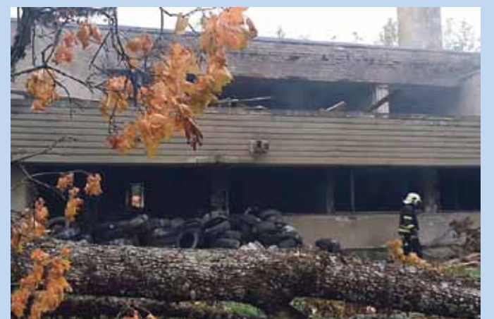
Endise Tsooru kolhoosi kontorihoones põlesid vanad autorehvid. Autorehve jagub nii hoone sisse kui ka kõikjale väljapoole hoonet.