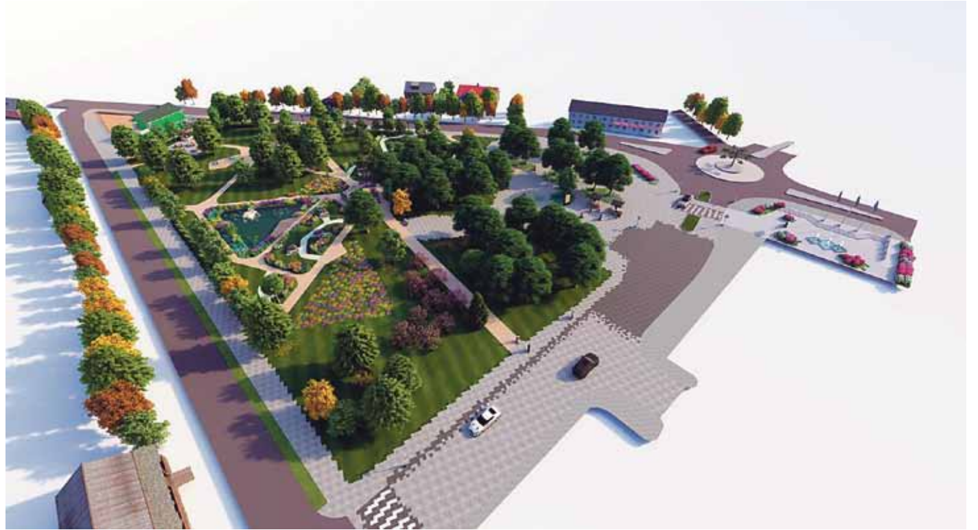
Osäühing Loovald on koostanud Antsla kesklinna maastikuarhitektuurse ehitusprojekti.

Ühe inimeste väljavoolu peamiseks võimalusena näeb Antsla vald Antsla kesklinna atraktiivsemaks muutmist. Nii nähakse järgneva kolme