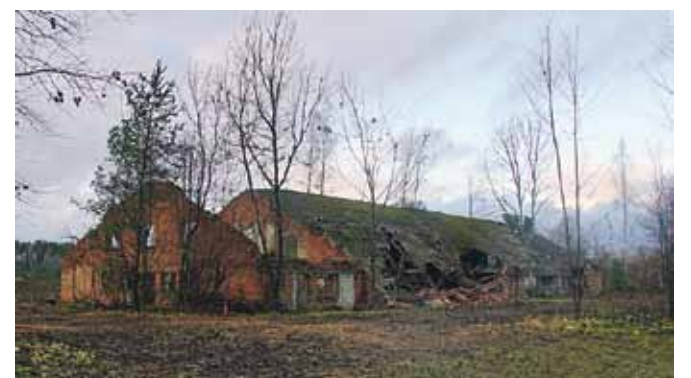
Endise J. M. Sverdlovi nim kolhoosi sigala varemed on pärast tormimurru kõrvaldamist taas kõigile ilusti näha. Pilt on tehtud 10. novembril 2023.